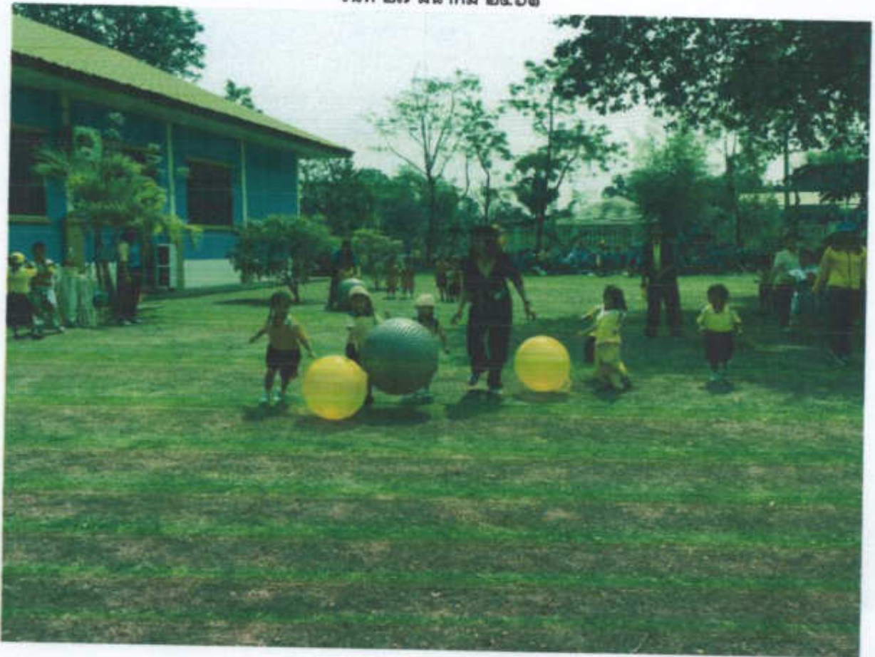
กีฬาसानสัมพันธ์ฟ้าเหลือง ปีการศึกษา ๒๕๖๐ วันที่ ๒๗ มีนาคม ๒๕๖๑