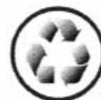
ความยั่งยืน