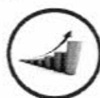
ความมั่งคั่ง