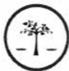
ความมั่นคง

วิสัยทัศน์ : “ประเทศไทยมีความมั่นคง มั่งคั่ง ยั่งยืน เป็นประเทศพัฒนาแล้ว ด้วยการพัฒนาตามปรัชญาของเศรษฐกิจพอเพียง”